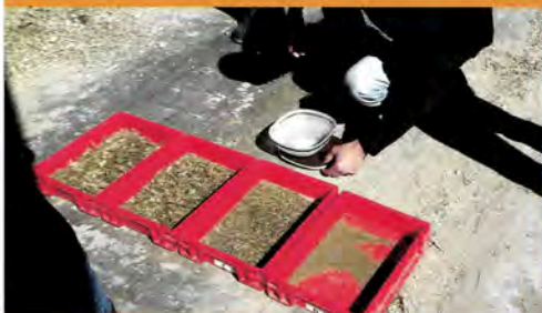
Prendre 500 g de ration, au-delà le tamis supérieur est surestimé.