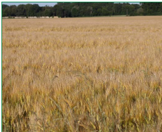
Les orges mûrissent