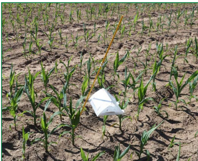
Piège à pyrale (à phéromone)