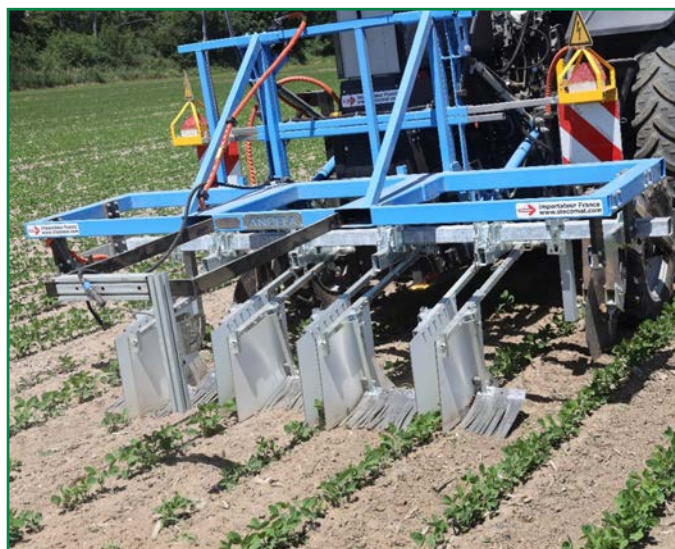
Essai d'un outil de désherbage électrique