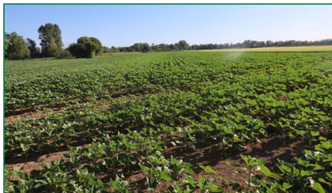
Belle parcelle (stade bouton étoilé)

(1) Peut être réalisé à l'occasion du désherbage ou de l'application du fongicide.