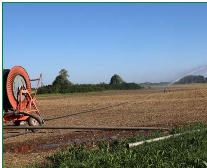
Irrigation en cours