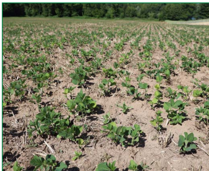
Beau soja en semis direct