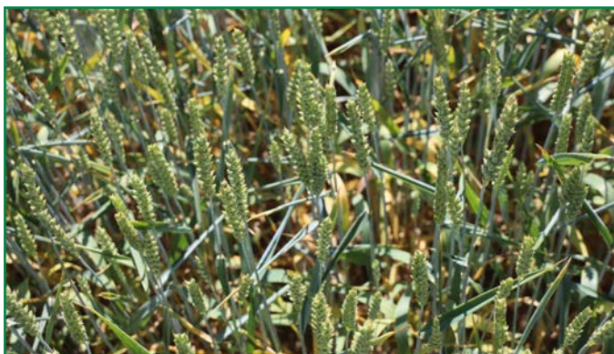
Stress thermique : feuille qui s'enroule

> Gestion des maladies > Cécidomyies/pucerons